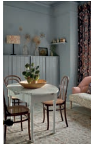
HYGGE: Gamle glasflasker som vaser, eit litt slitent spisebord og stolar som ikkje matchar. Likevel osar rommet av hygge og kos.