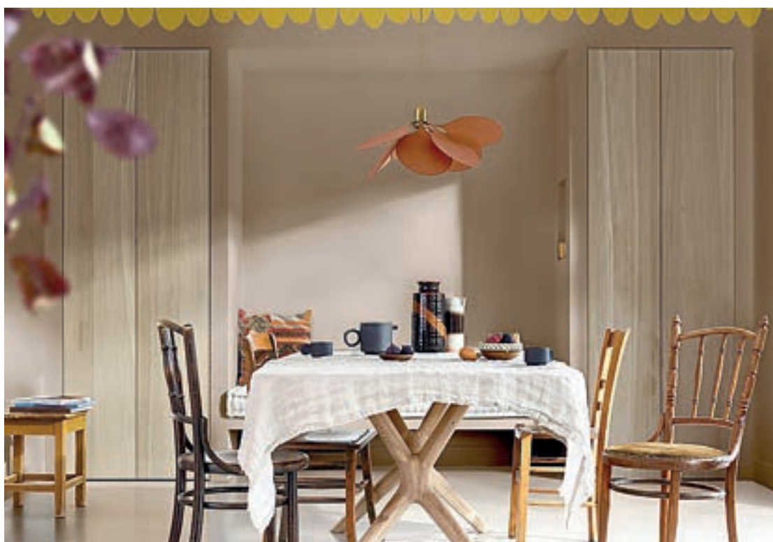
SANN GLEDE: Årets farge 2025 frå Nordsjø er ein optimistisk, modig og glad gulfarge med mykje kulør, som spelar på lag med fleire andre fargar. Her kan ein skimte ein leiken gulfarge som handmåla bord øvst i biletet.