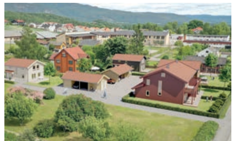
VILLASTRØK: Bustadprosjekt med tre einebustadar og ein tomannsbustad. FOTO: Illustrasjon