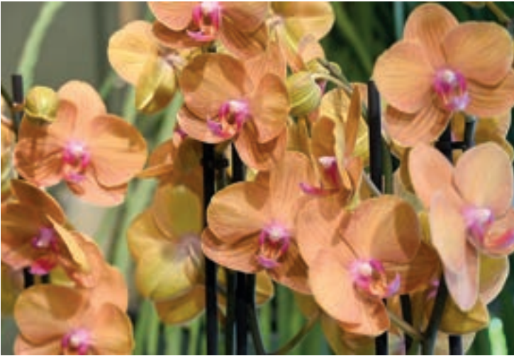
ORKIDE: Orkide går ikkje av moten. Fargespekteret er stort.