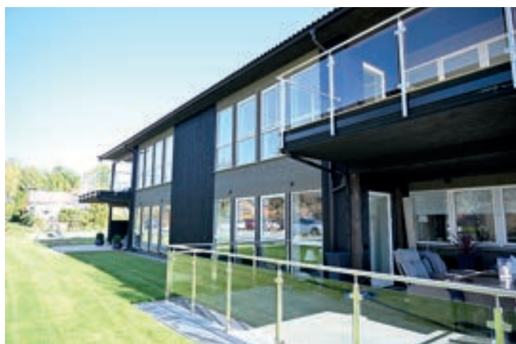
FIREMANNSBUSTAD: Her ser ein vestsida av bygget med store vindaugsflater og uterom.

Dei reknar med byggjastart på neste trinn skjer i løpet av hausten.