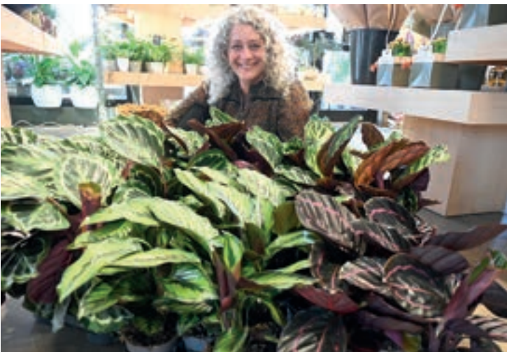
CALATHEA: Calathea er ei frodig og flott plante som kjem i mange ulike fargenyansar.