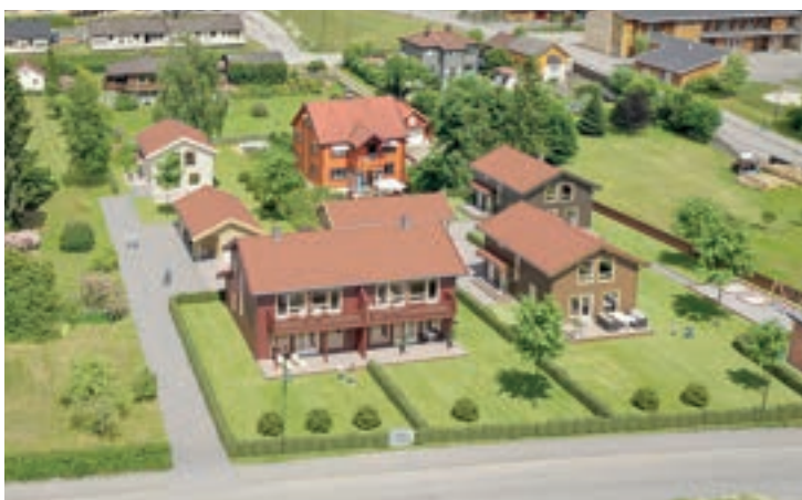
LEKTORVEGEN I BØ: Droneskisse av tomte i Lektorvegen med tre nye einebustader og tomannsbustad. 3D Huset. FOTO: Illustrasjon

get, seier Elin. Ho legg til at ein hyggeleg raudfarge på taksteinen var eit enkelt val.