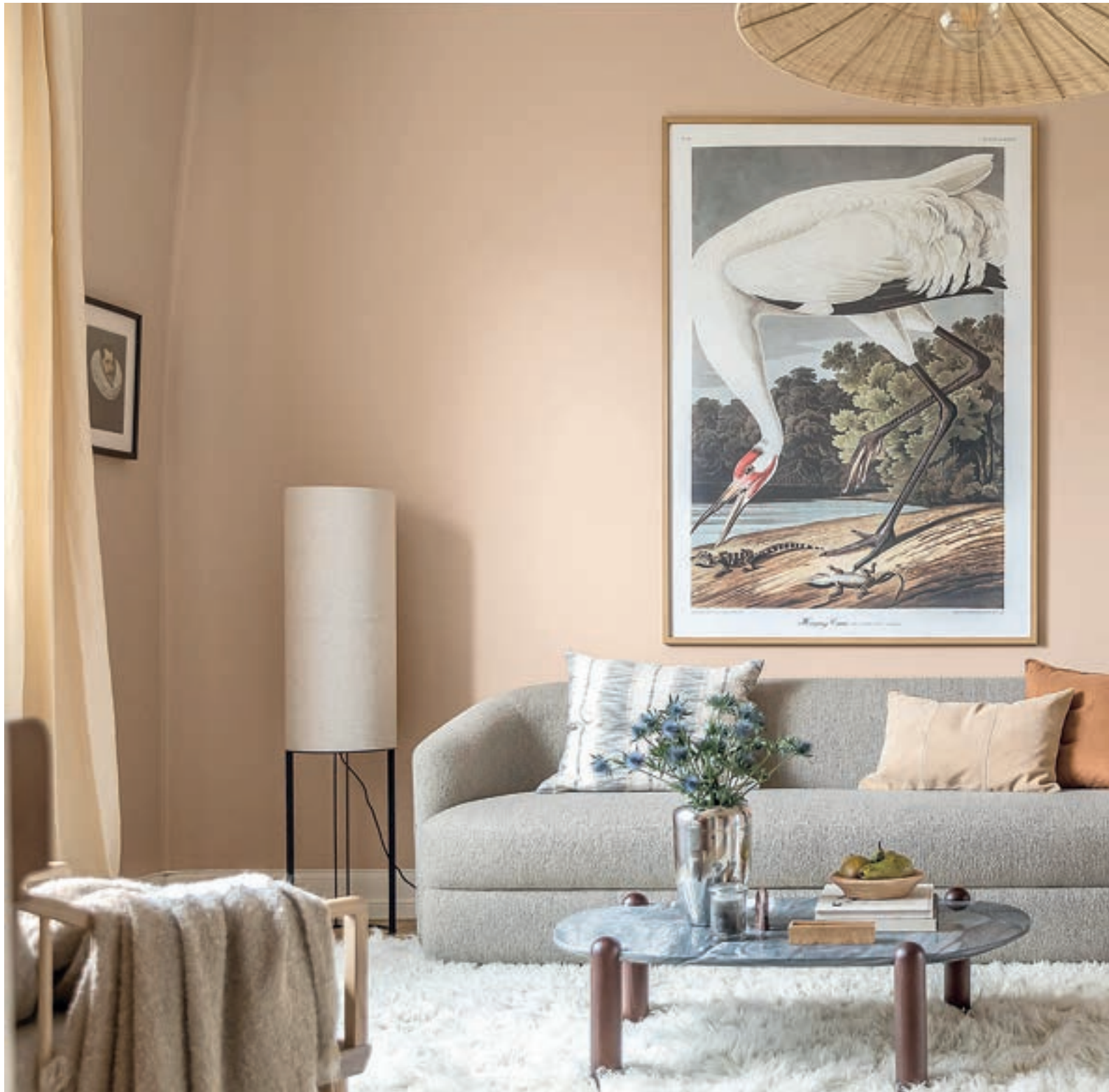
LUFT: Varme ferskenfargar er med, og denne duse versjonen gir rommet ei lett og luftig kjensle.

– Dette blir òg reflektert i den fargepaletten som Alcro og livsstilsmagasinet Elle har teke fram for hausten 2024, der bordeaux, dus rosa og lys blågrøn saman med vanilje og kvitt danner grunnlaget for eit fargerikt og balansert uttrykk, legg Sveinsen til.