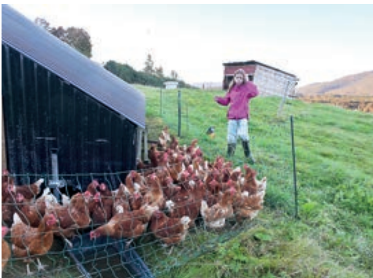
HØNER: 60 høner produserer egg som dei sel på Reko-ringen og i bua ved riksvegen.