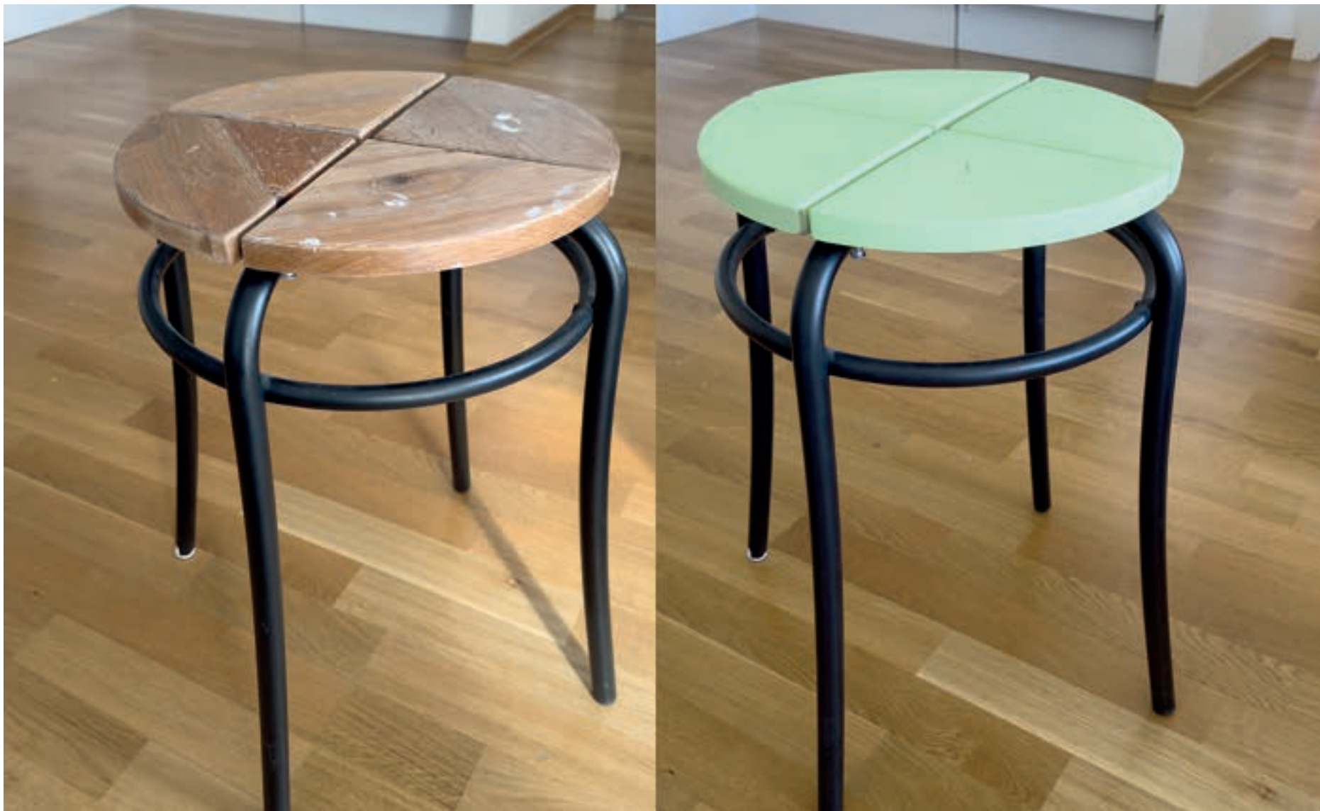
BLI NY: Denne gamle krakken passa ikkje inn i leiligheita der han skulle bu, men med litt måling fekk han nytt liv. Skulle ein gå lei av fargen, kan ein måle krakken på nytt, eller pusse den ned og beise. Det er mange moglegheiter for å tilpasse det du allereie har, til stilen du ønskjer deg.