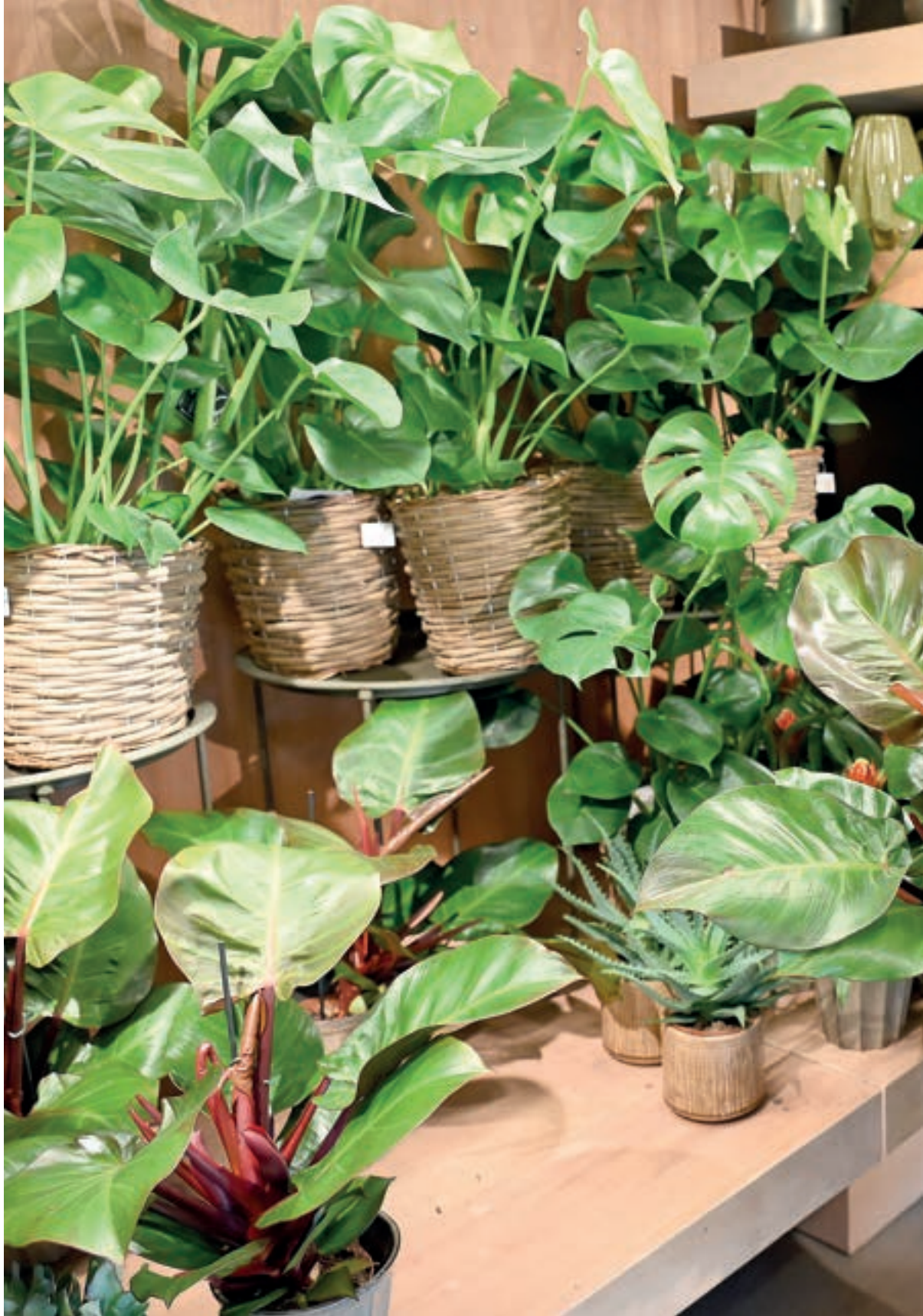
GRØN OASE: Veslemøy Gundersen med philodendron, ei av hennar favorittplanter.