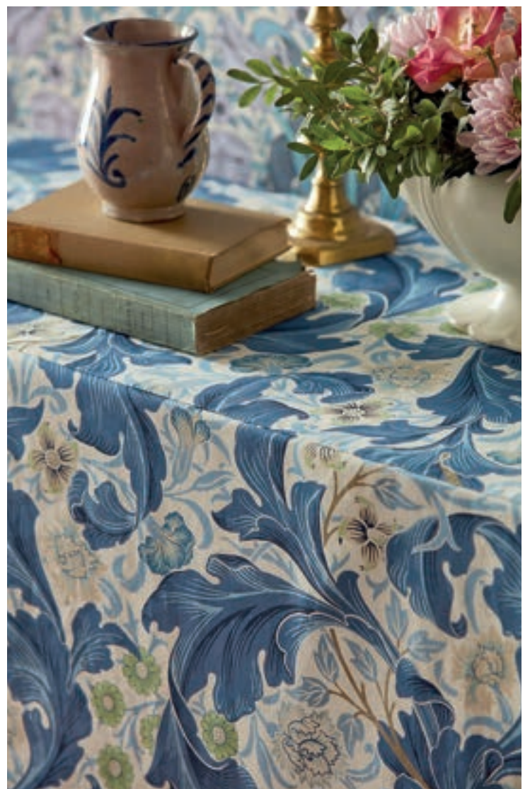
MØNSTER: Tekstilmønster treng ikkje lenger å matche så slavisk som det har gjort tidlegare. Blomar, striper, prikkar og fargar kan gjerne kombinerast som krydder i interiøret.