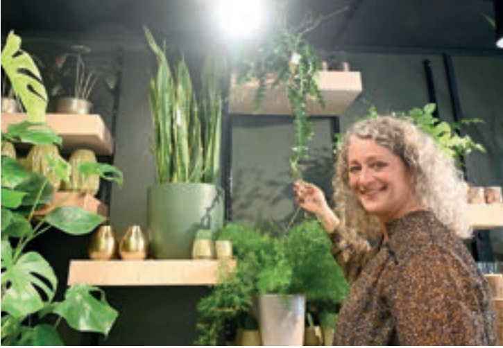
SVIGERMORS TUNGE: Svigermors tunge er tilbake som ein av haustens trendy planter.