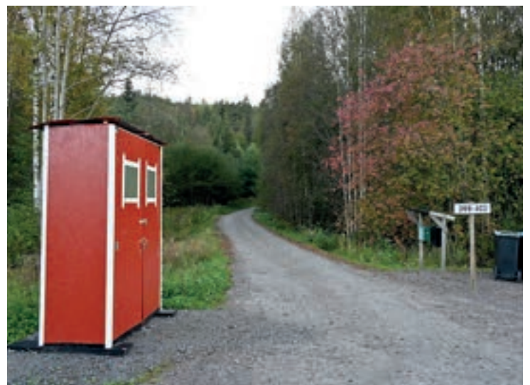
INN I SKOGEN: Her startar vegen til småbruket i skogen.