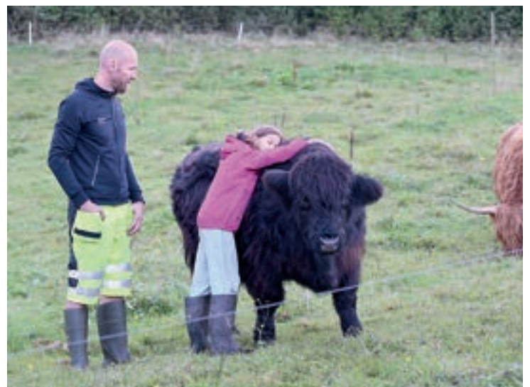
HØGLANDSFE: Ei kvige og ein okse av rasen høglandsfe lever gode dagar.