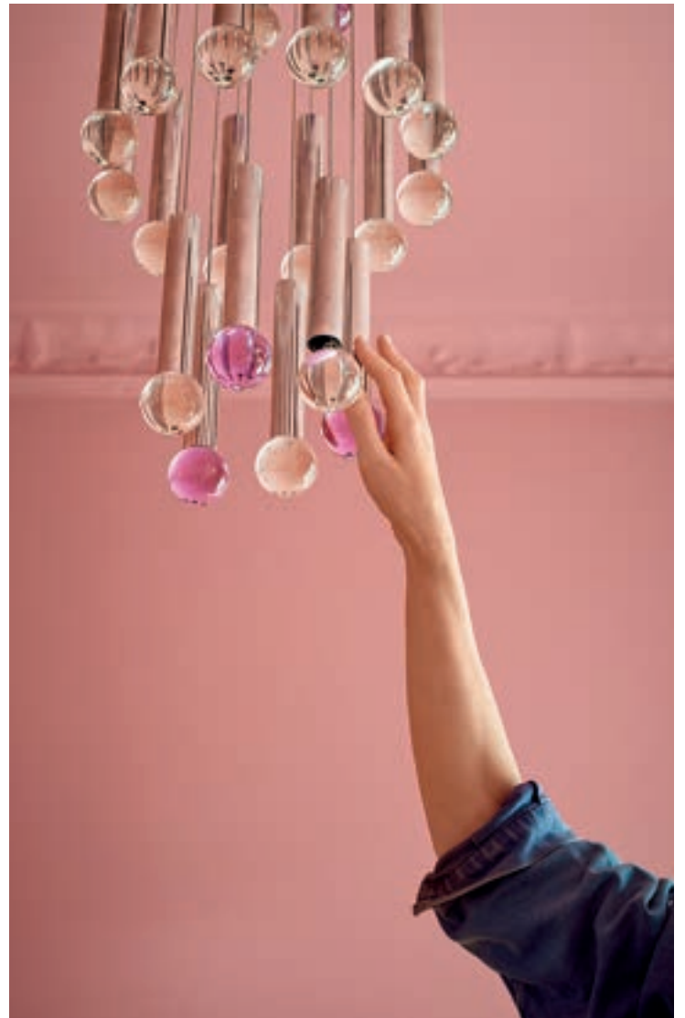
ROSA MAKSIMALISME: Personlegdom og eit interiør som seier kven ein er, tar over plassen til minimalismen.