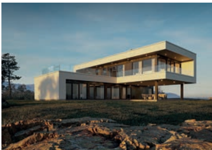
LIFJELL: Hus av typen Lifjell frå Vestlandshus.