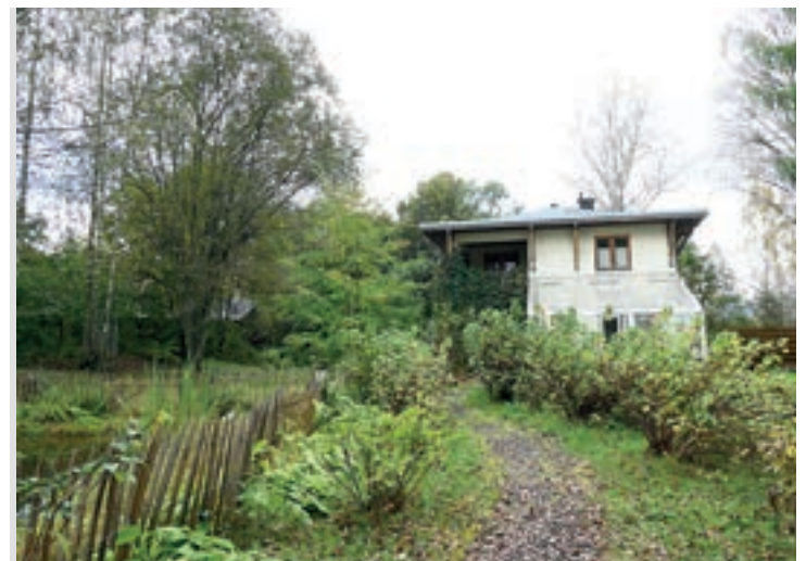
STOR HAGE: Det er stor hage til huset.