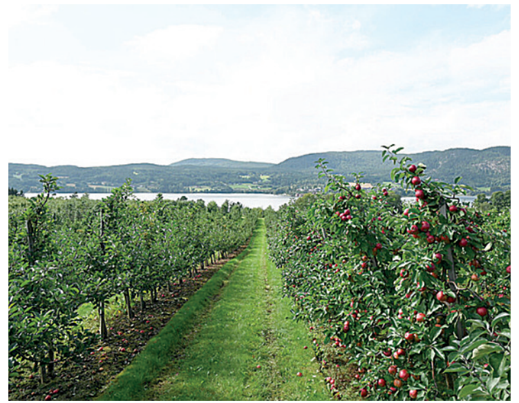
VED NORSJØ: Trond Henning Kirkestuen sin eplehagen på garden Langjordet, er ein av mange flotte fruktgardar ved Norsjø.