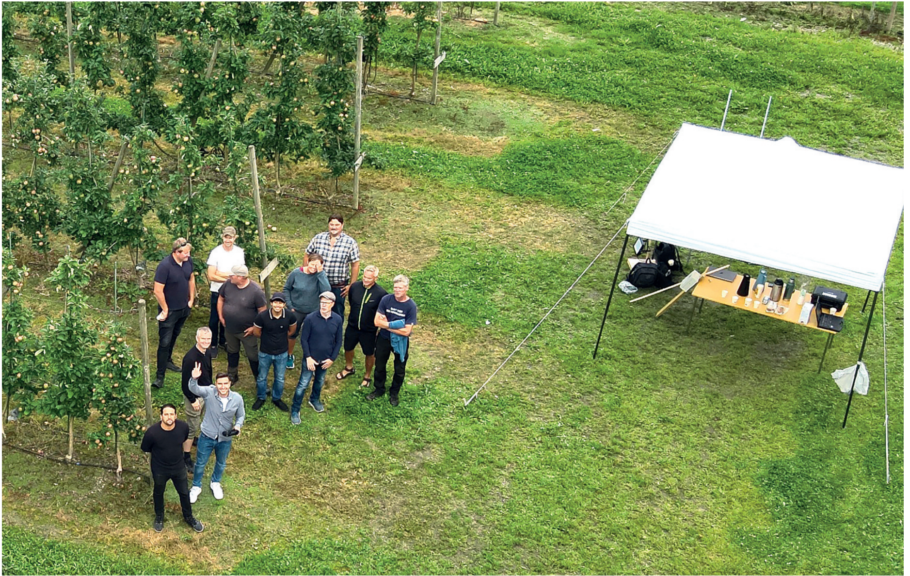
DRONE I EPLEHAGEN: Folk frå fagmiljøa ved Universitetet i Sørøst-Noreg og aktørar frå fruktneringa i Midt-Telemark var samla på Årnes til demonstrasjon 8. august i år.