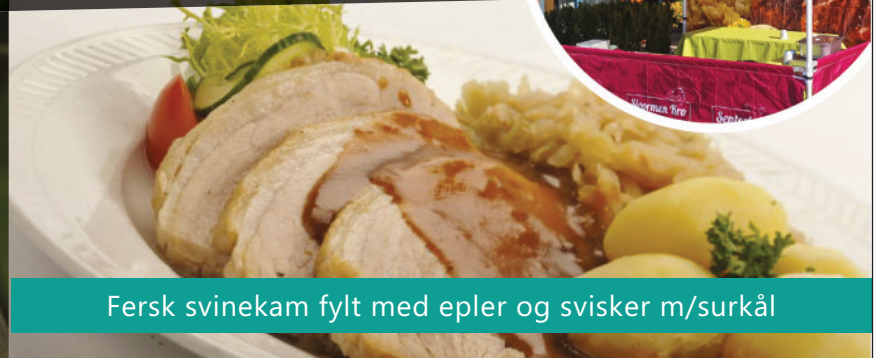
Fersk svinekam fylt med epler og sviker m/surkål

PRØV OGSÅ Eplefestburger m/eple og kålsalat Svinegryte m/epler og jordeplestappe