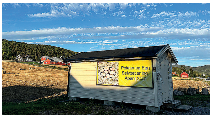
EI BU VED VEGEN: Salgsbua i Seljordvegen 628 i Øvre Bø har selvbetjening, poteter og egg.