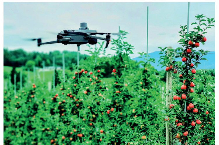
FRAMTIDA FOR NÆRINGA: Ei drone på oppdrag med å overvake eple og tre i ein hage på Gvarv.

– Målet er at resultatet skal bli ein digital plattform og eit nyttig verktøy for bruk av både eplebonden og andre aktørar i næringa og verdikjeda, seier Semb Vestgarden.