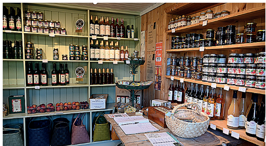
PÅ LÅVEN: På Nyhuus gard har vertskapet ein stilfull sjølvbetent butikk.