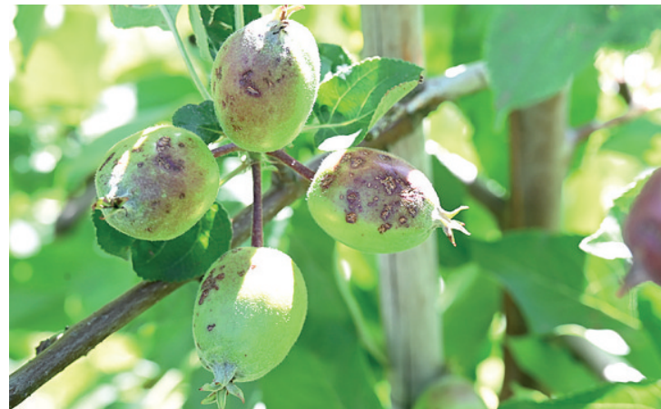
HAGLSKADAR: I juni førte kraftige haglbyger til skade på blant anna eple hjå fleire produsentar. No skal desse epla pressast.

– Ut og kjøp! No er epla på det beste, stemmer Holtskog i.