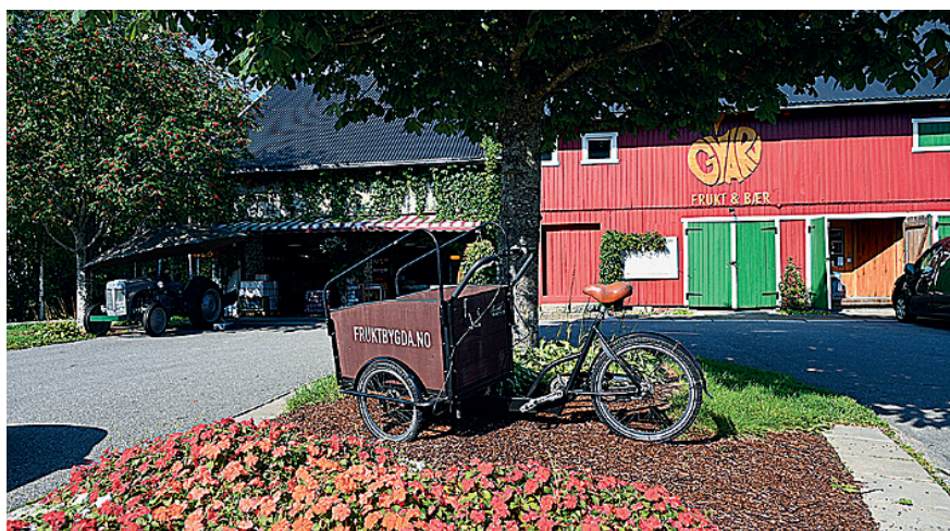
STOR BUTIKK: Gvarv frukt og bær har sentral plass ved riksvegen.